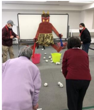
「玉入れ」で「鬼たいじ」