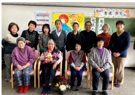
1月3日 お正月の記念写真