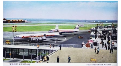
昭和時代の羽田空港